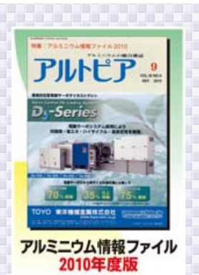
アルミニウム情報ファイル 2010年度版